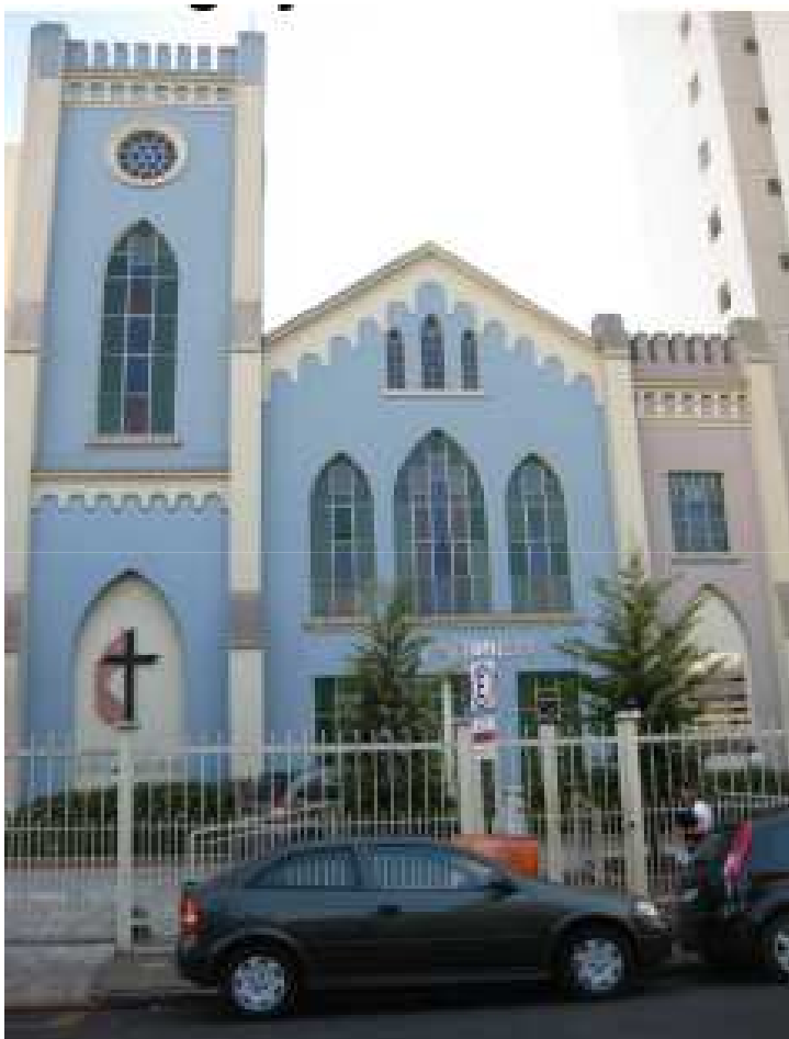
Foto: Fachada Frontal – Rua São Sebastião, 728. Fonte: Rede de Cooperação identidades Culturais. Dez. 2011.