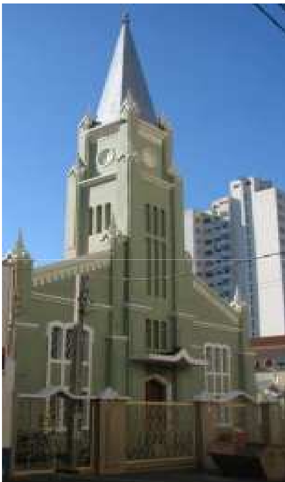
Foto: Fachada Frontal – Rua Barão do Amazonas, 258. Fonte: Rede de Cooperação Identidades Culturais. Dez. 2011.