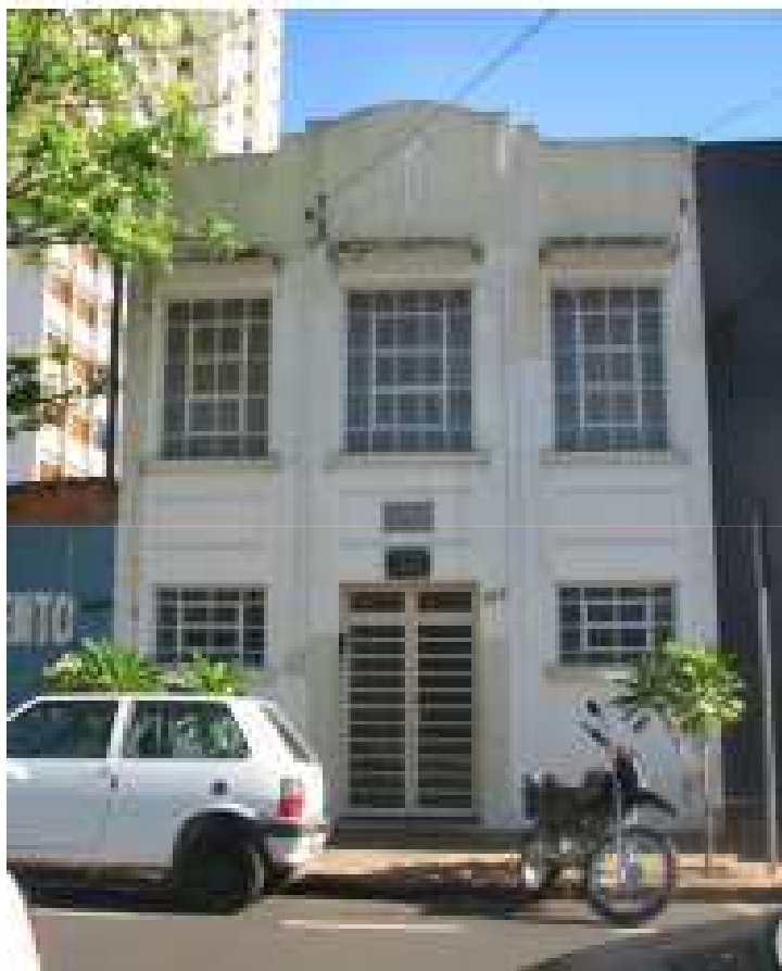
Foto: Fachada Frontal – Rua Mariana Junqueira. Dez. 2011.