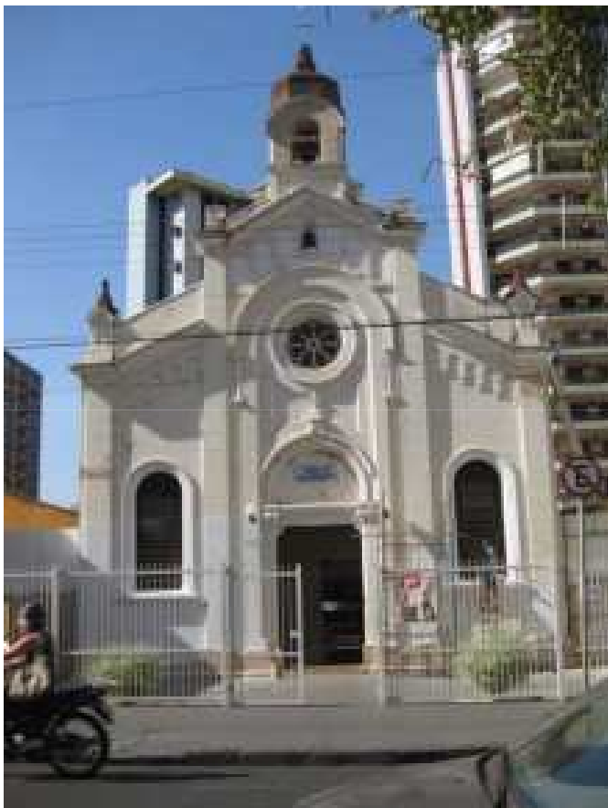
Foto: Fachada Frontal – Rua Prudente de Moraes, 667. Dez. 2011.