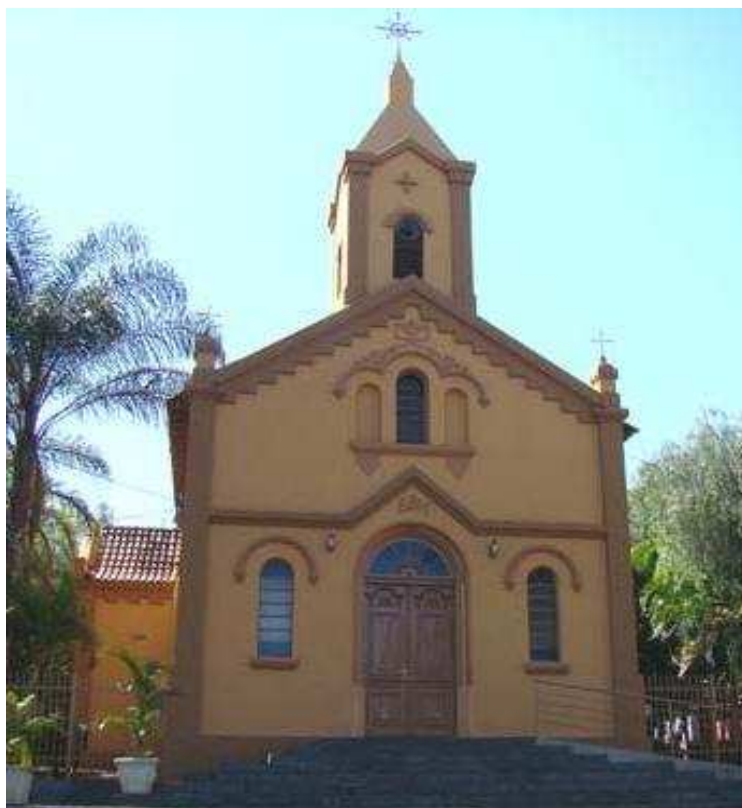
Senhor Bom Jesus do Bonfim