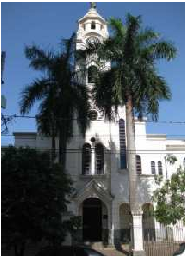
Foto: Fachada Frontal – Rua São José, 743. Dez. 2011.