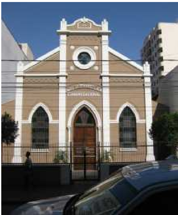
Foto: Fachada Frontal – Rua Barão do Amazonas. Dez. 2011.